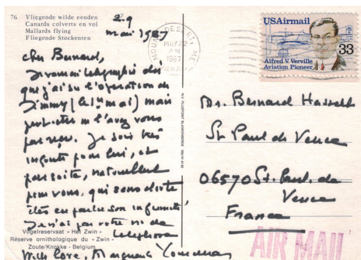
Fig. 4) Carte de Marguerite Yourcenar du 29 mai 1987