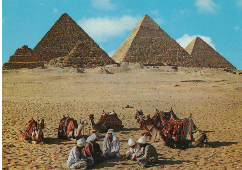
Fig. 1) Illustration de la carte postale du 16 janvier 1982

Je suis celui qui est au milieu, hi, hi, hi,