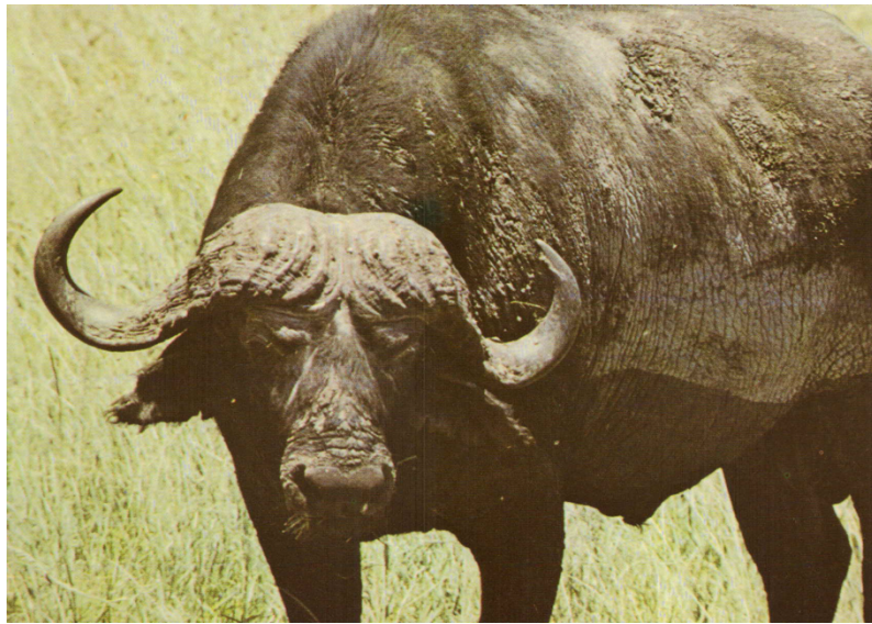
Fig. 3) Illustration de la 2 e carte postale du 3 janvier 1984